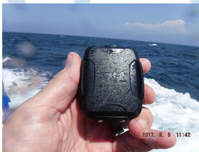
Figura 6.- Rastreador satelital SPOT Tracker a ser instalado en boya Tether .

Para seguir rastreando la boya Tether , el equipo de investigadores se propuso a instalar el rastreador satelital SPOT Tracker (Fig. 6) que llevaron de respaldo. Nos aproximamos por la banda de babor de la EM Rigel a la boya Tether , procediendo el Ocean. Rodrigo Alcaraz a abordar la boya (Fig. 7), instalar el nuevo rastreador satelital SPOT en la base que para tal fin se encontraba en la torre metálica, lanzarse al agua y nadar de regreso a la EM Rigel , recalcando que el Ocean. Alcaraz portaba su traje para buceo en todo momento, para seguridad durante dicho proceso.