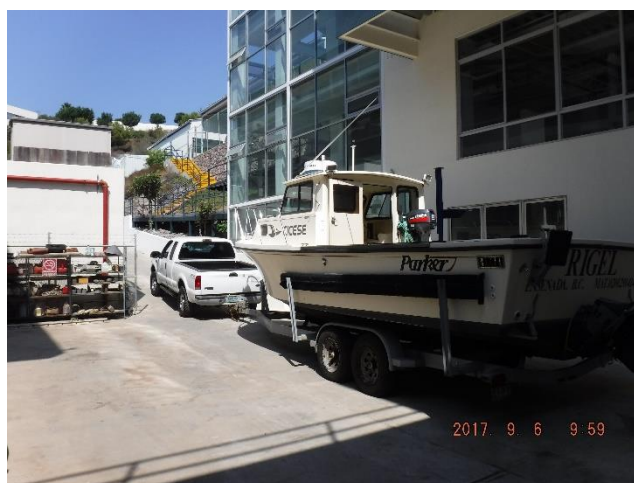
Figura 1.- EM Rigel y unidad 15-C siendo subidas al estacionamiento trasero del edificio de Oceanología.