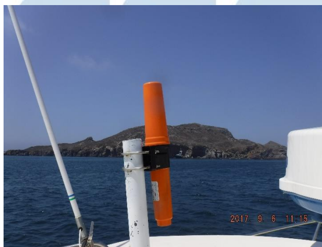
Figura 4.- Rigel navegando cerca de isla Todos Santos Sur buscando boya Tether .

Al no encontrar la boya Tether a la deriva, el grupo de participantes intuyó que probablemente hubiera sido vandalizada, con la posibilidad de que la boya se encontrara en su posición de instalación y alguien a bordo de otra embarcación se hubiera aproximado a la boya para vandalizarla, llevándose los rastreadores satelitales SPOT Tracker . Procedimos entonces a navegar rumbo al punto de instalación de la boya Tether , alrededor de 1.5 nmi al Oeste-Noroeste de islas Todos Santos, aprovechando la oportunidad para navegar cerca de la parte protegida de las islas en caso de que la boya estuviera en los alrededores (Fig. 4).