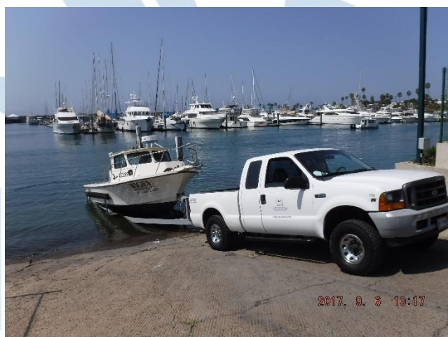
Figura 2.- Botando la EM Rigel en la marina de Hotel Coral.

Al salir de la rada artificial de la marina de Hotel Coral, se encontraron condiciones meteorológicas como sigue: Tiempo de bueno a regular, oleaje de 0.9 metros de altura, viento aparente del Oeste-Noroeste (WNW) de alrededor de 10 nudos, cielo en una octa, Cumulus , visibilidad buena de alrededor de 5 millas náuticas (nmi). Llegamos a las 11:54 horas al punto reportado por la última transmisión de uno de los rastreadores satelitales SPOT Tracker , procediendo a realizar una inspección del área con binoculares y a vista normal, sin localizar visualmente la boya Tether en las cercanías (Fig. 3). Este punto se localizaba a 1.6 nmi al Este de las islas Todos Santos.