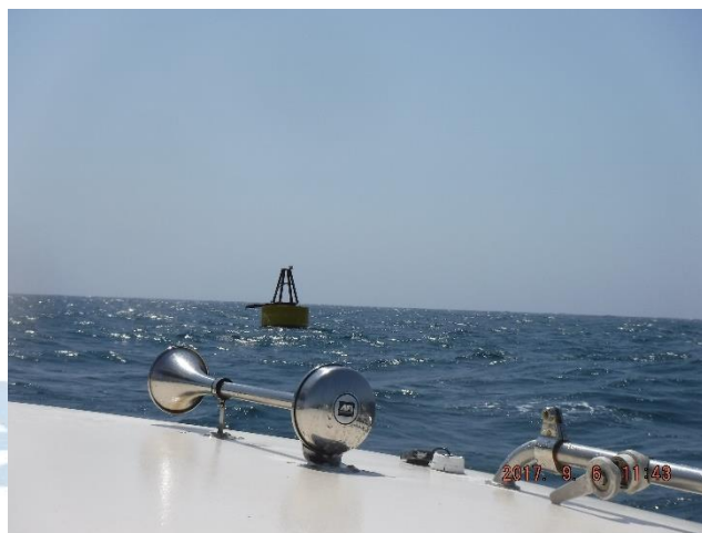
Figura 5.- Llegando al sitio de instalación de la boya Tether , confirmando que se mantiene en su posición.

Siendo las 12:36 horas, realizamos contacto visual con la boya Tether (Fig. 5), misma que seguía instalada en su lugar, con la novedad de que aún estaba presente en la estructura la luz de señalamiento y la torre metálica, faltando los rastreadores satelitales SPOT Tracker .