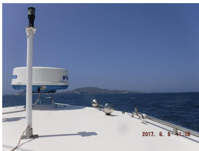
Figura 3.- Isla Todos Santos Sur a la vista durante búsqueda visual de boya Tether .

Al no encontrar la boya Tether a la deriva, el grupo de participantes intuyó que probablemente hubiera sido vandalizada, con la posibilidad de que la boya se encontrara en su posición de instalación y alguien a bordo de otra embarcación se hubiera aproximado a la boya para vandalizarla, llevándose los rastreadores satelitales SPOT Tracker . Procedimos entonces a navegar rumbo al punto de instalación de la boya Tether , alrededor de 1.5 nmi al Oeste-Noroeste de islas Todos Santos, aprovechando la oportunidad para navegar cerca de la parte protegida de las islas en caso de que la boya estuviera en los alrededores (Fig. 4).